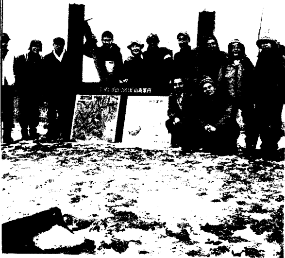
冬のシダング山山頂。標高が低く、冬季でも気軽に登れる

寄自然休養村 寄バス停のすぐ近くにある。村内の観光センターでは、寄一帯の自然や民俗についての資料を展示している。また、村内にはほかに清涼マス釣り場やキャンプ場などもある。 ☎0465・89・2321